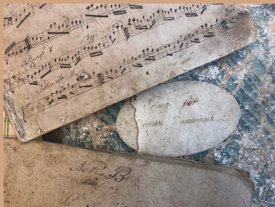
De tre nothäftena är i gott skick. Löresamlingen är inbunden, de båda andra är häftade