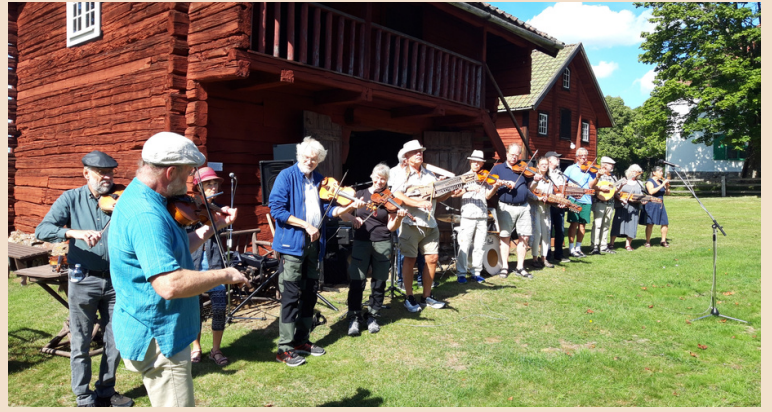
Allspel framför hembygdsgården